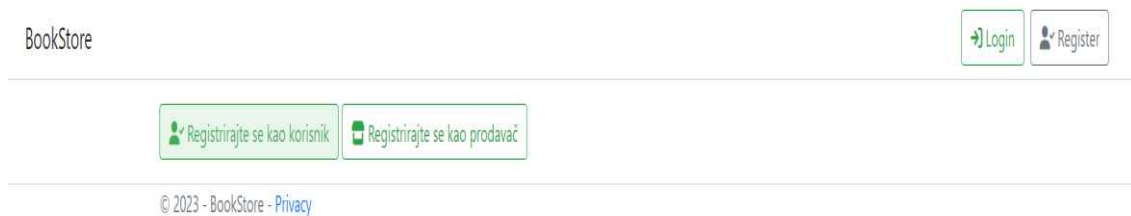
Slika 1. Prikaz odabira korisničke uloge prilikom registracije

Aplikacija nudi mogućnost registracije dva tipa korisnika: kupca i prodavača. Svaki od ta dva tipa ima pristup samo određenim modulima i funkcionalnostima. Neautenticiranom korisniku omogućen je samo pregled proizvoda. Prilikom klika na tipku za registraciju, korisnik može odabrati ulogu kojom se želi registrirati (Slika 1).