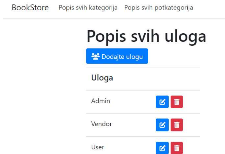
Slika 4. Sučelje za popis postojećih te dodavanje novih uloga

Jedna od funkcionalnosti koje administrator aplikacije ima na raspolaganju je dodavanje novih uloga te uređivanje postojećih (Slika 4).